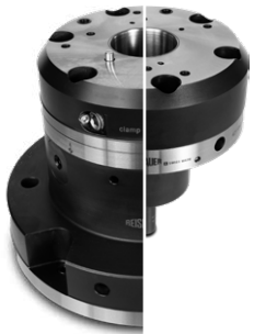
Die Basiseinheit Reishauer FK 38 (oben) und das Schnellwechselsystem FH 38 (unten) mit Anschluss für beide Spindelgrössen.

Die Basiseinheiten und Schnellwechselsysteme von Reishauer vereinheitlichen die Spannmittelschnittstelle unterschiedlicher Maschinentypen und ermöglichen unseren Kunden maximale Flexibilität. Für den Einsatz in der Klein- und Mittelserienfertigung wird eine einheitliche Plattform geschaffen, auf der vorhandene Spannmittel schnell und zeitsparend eingesetzt und gewechselt werden können. Auf dieser Basis können grosse Werkstücksortimente und häufig wechselnde Werkstücke wirtschaftlich bearbeitet werden.